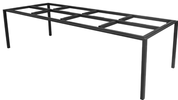
AL Lava grey