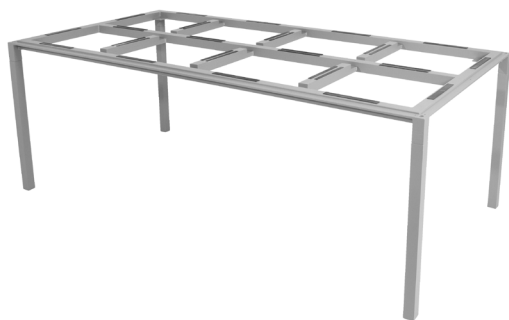
Al Light grey