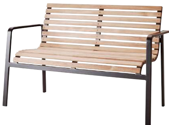
TAL Teak/Lava grey