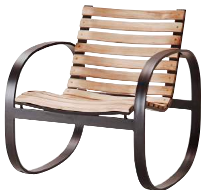
TAL Teak/Lava grey